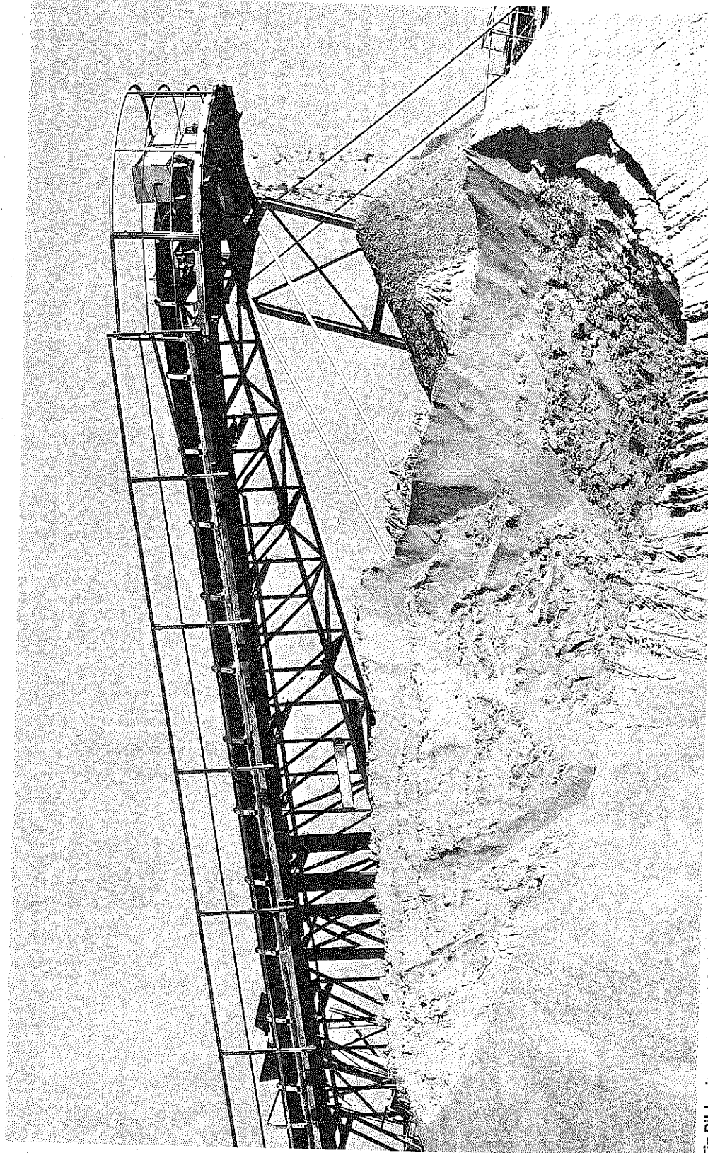
Ein Bild, wie man es am Niederrhein häufig sieht: Das Thema Kies- und Sandabbau beschäftigt die überdurchschnittlich stark beanspruchte Region seit Jahrzehnten. Naturschützer fordern ein Ende der Abgrabungen.